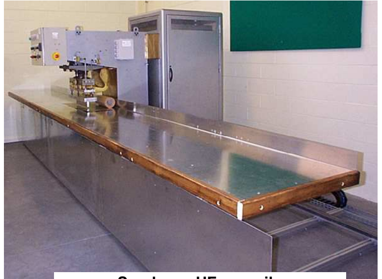
Soudeuse HF sur rails Déplacements motorisés

Vous pouvez nous adresser un croquis, une photo ou bien des échantillons pour tester la soudabilité de vos produits.