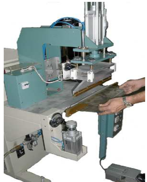
Soudage de manchettes avec une contre-électrode en porte-à-faux et un vérin pour compenser la pression