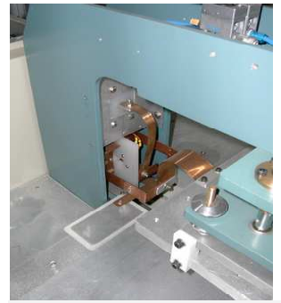
Interrupteur HF en sortie du générateur

Toutes applications sur mesure en fonction de vos productions