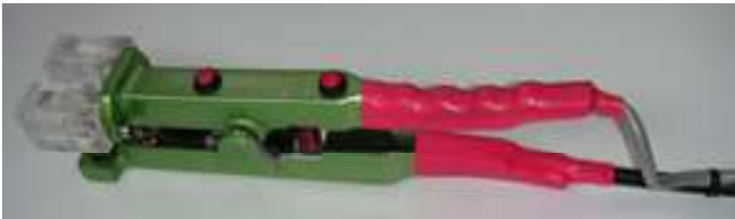
Pince mobile à ressort pour des réparations sans démontage.