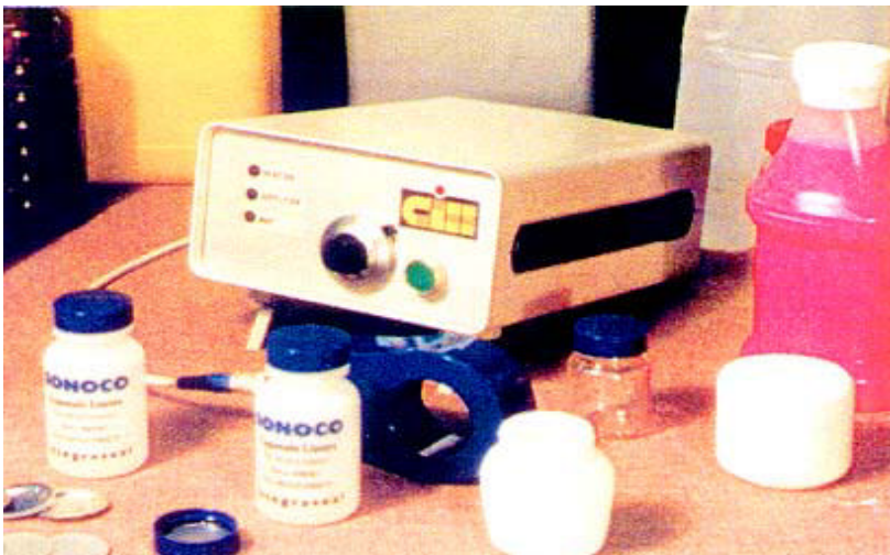
Inducteur moulé pour scellage manuel en laboratoire avec le TR0. Nous fournissons ces inducteurs avec condensateurs et poignée en fonction des applications.