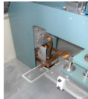
Interrupteur HF en sortie du générateur

Toutes applications sur mesure en fonction de vos productions