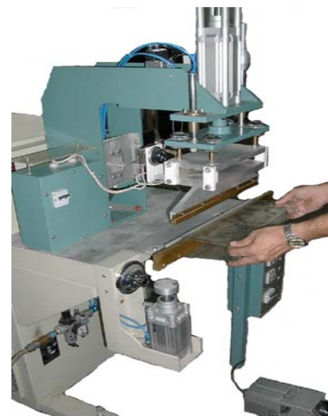
Soudage de manchettes avec une contre-électrode en porte-à-faux et un vérin pour compenser la pression